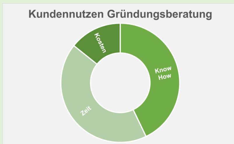
Abbildung 2 Kundennutzen bei der Gründungsberatung

Kundennutzen: Zeitersparnis, Wissensgewinn, Kostenersparnis